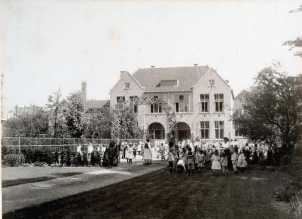
De School Mühring begin vorige eeuw